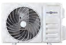
HCNTS 260-350 ZA