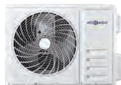
HCNTS 530 ZA