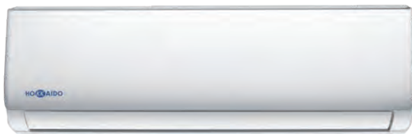
HKETM 260-710 ZAL

Standardní dálkové ovládání s vestavěným teplotním čidlem (I-Feel funkce)