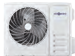
HCNTS 710 ZA